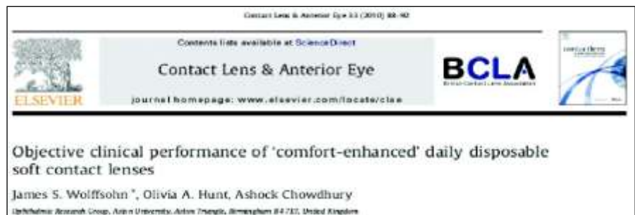
Fig.2 Published study to investigate the performance of "comfort enhanced" daily disposable soft contact lenses

In acest sens, materialul lentilelor DAILIES AquaComfort Plus a furnizat rezultate superioare.