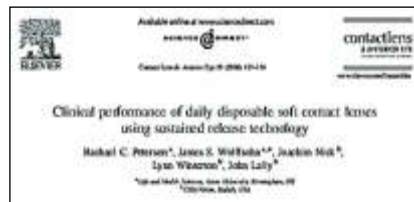
Fig.1 Published study describing development of CIBA VISION's AquaComfort material 8

Grupul de studiu Brian Tighe de la Universitatea Aston (U.K) a descoperit ca acest material, care in compozitie polivinil alcool (PVA) polimerizat, elibereaza o parte din continut catre ochi, in timpul portului 6 . PVA este cunoscut ca supliment lacrimal, fiind constituintul principal a numeroase tipuri de lacrimi artificiale 7 . In 2006, acesti autori au demonstrat ca o crestere a cantitatii de PVA inclus in matricea lentilei are ca efect cresterea confortului.